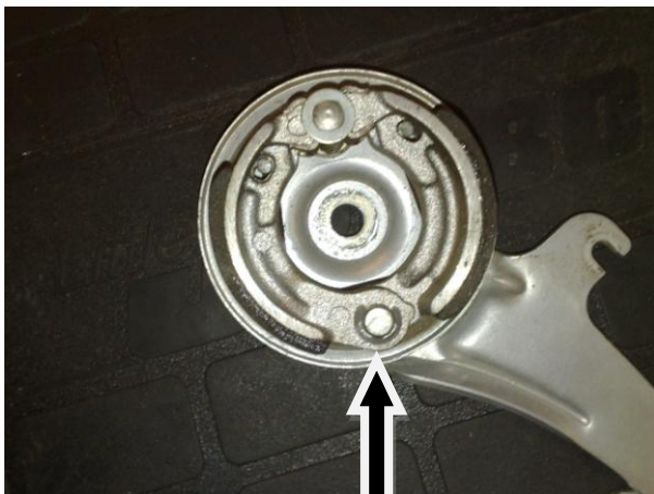
Die Sicherungsscheibe entfernen