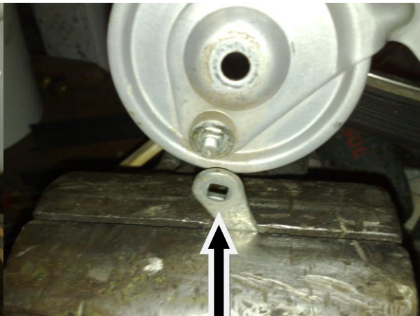
Vom Brems Hebel trennen