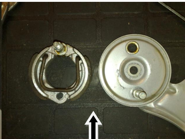
Die Backen komplett mit Spreiz - mechanismus herausnehmen und umdrehen