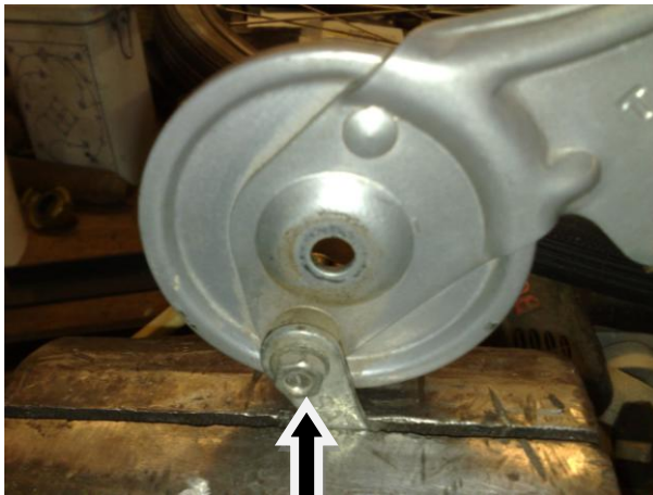
Die Mutter SW 10 entfernen